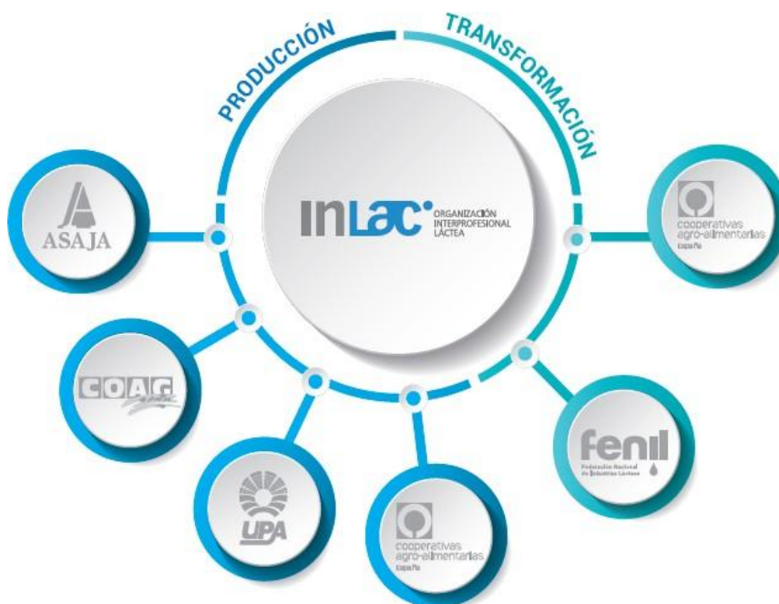
Figura 1. Organizaciones miembro de InLac.

Los miembros de InLac son asociaciones sin ánimo de lucro que representan a productores y transformadores de leche de vaca, oveja y cabra. Como representantes de la rama de la producción participan las organizaciones profesionales agrarias ASAJA, COAG, UPA y Cooperativas Agro-Alimentarias de España y como representantes de la rama transformadora participan las asociaciones FeNIL y Cooperativas Agro-alimentarias de España.