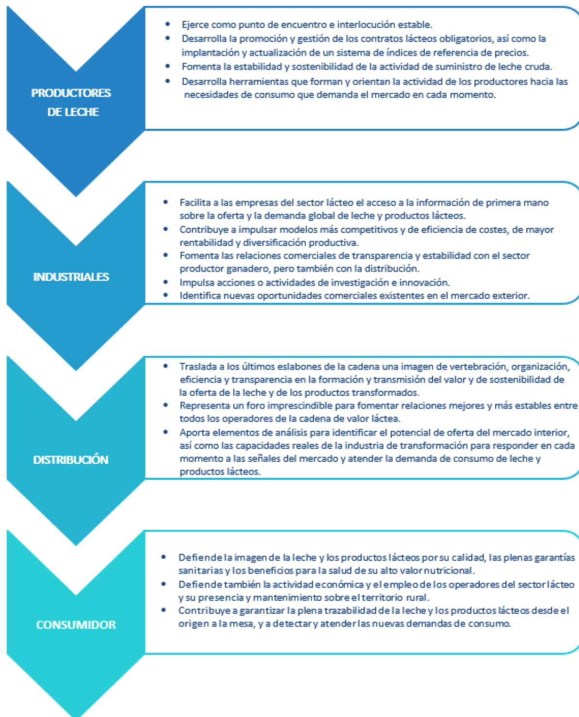
Figura 3. Rol de la interprofesional con los eslabones de la cadena.

La interprofesional ejerce un papel fundamental con cada uno de los eslabones de la cadena del sector lácteo, como se muestra en la figura 3.